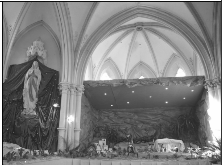
Crèche de Longchamps

Si vous souhaitez la placer au cœur de vos maisons, pensez à prévoir une lampe fermée pour le transport.