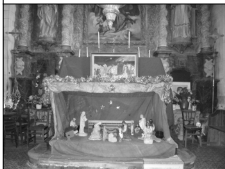
Crèche de Vieux