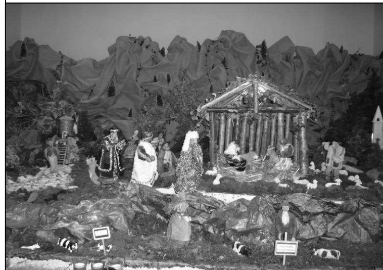
Crèche de Longchamps