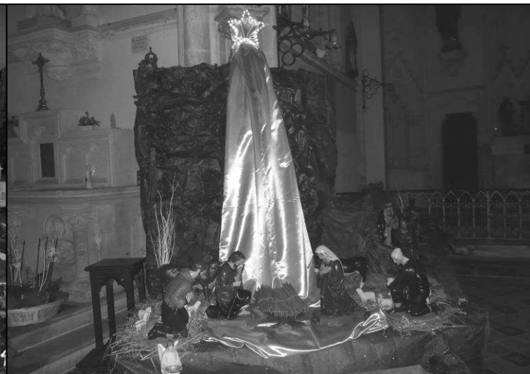
Crèche de Sainte-Honorine-du-Fay

Chaque année, des bénévoles se mobilisent pour perpétuer la tradition des crèches dans nos églises. Durant les week-ends de décembre et début janvier, c'est le moment de faire un « circuit des crèches » pour les découvrir en famille : église de Vieux, église d'Amayé-sur-Orne, Chapelle de Longchamps, Église de Ste-Honorine-du-Fay, église d'Avenay et église d'Évrecy.