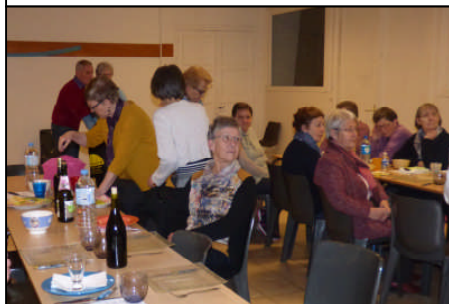
Soirée bol de riz